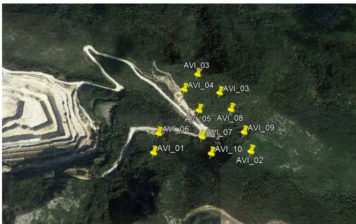
Figura 19 – Visione satellitare della distribuzione dei punti di ascolto uccelli.