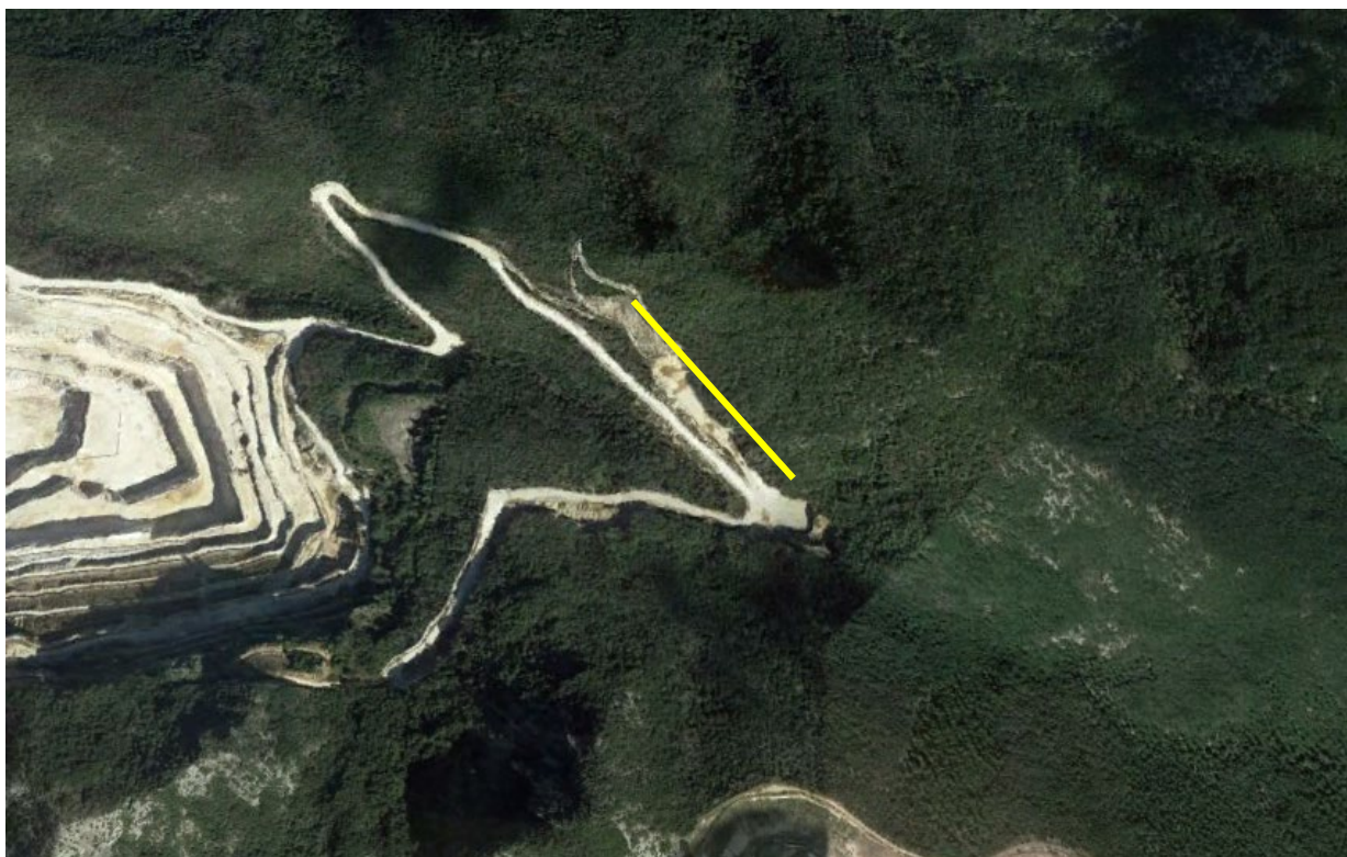
Figura 9 – Immagine satellitare del transetto MAM_01.