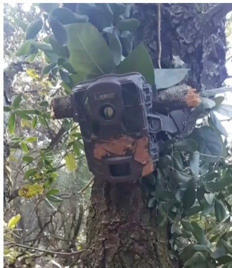
Figura 8 – Fototrappola posizionata su albero di leccio

Per i mammiferi (esclusi i chiroteri) il monitoraggio è finalizzato a rilevare la presenza di fauna di medie-grandi dimensioni (escludendo quindi piccoli roditori quali arvicole, talpe ecc.), mediante l'uso di fototrappole settate in modo da registrare un filmato (in formato .avi) della lunghezza di 20 sec ad ogni attivazione del sensore con un intervallo minimo di 2 minuti tra una attivazione e la successiva. Le fototrappole sono posizionate in aree idonee, in corrispondenza di potenziali punti di passaggio di fauna (Figura 8); ancorate ad un albero mediante apposita cinghia ad un'altezza di circa 2 m dal suolo e inclinata di circa 30° rispetto alla verticale in modo che l'inquadratura copra la maggior porzione possibile del terreno antistante.