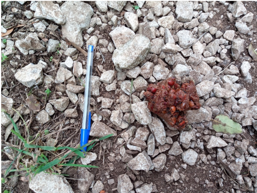
Figura 15 – Escremento di cinghiale ( Sus scrofa ) con residui vegetali