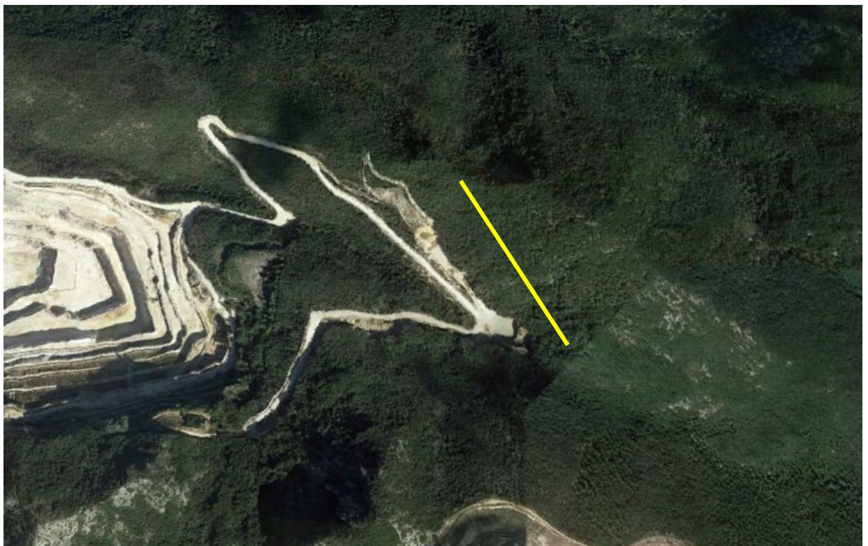
Figura 7 – Immagine satellitare del transetto ANF_03.