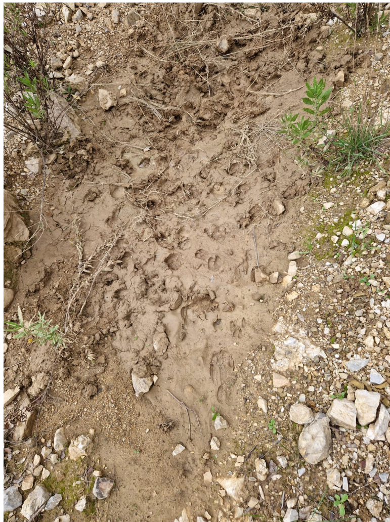
Figura 14 – Insoglio di cinghiale ( Sus Scrofa )