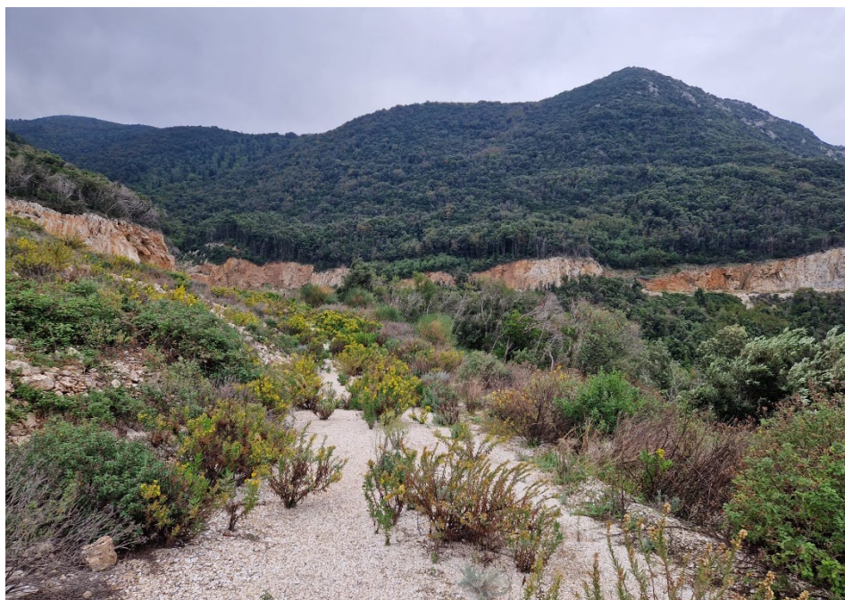
Foto 1 – Ampia visuale sull'area nord della cava e l'area di studio.