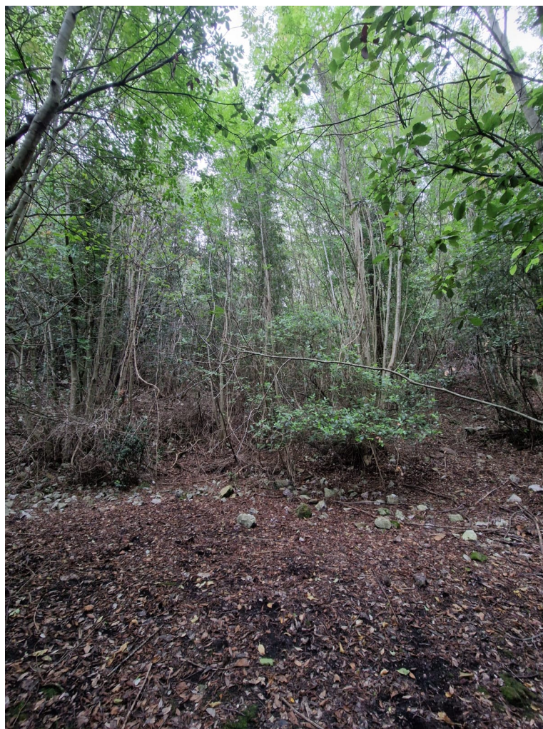
Foto 5 – Ambiente boschivo con Leccio ( Quercus ilex ) e Orniello ( Fraxinus ornus )