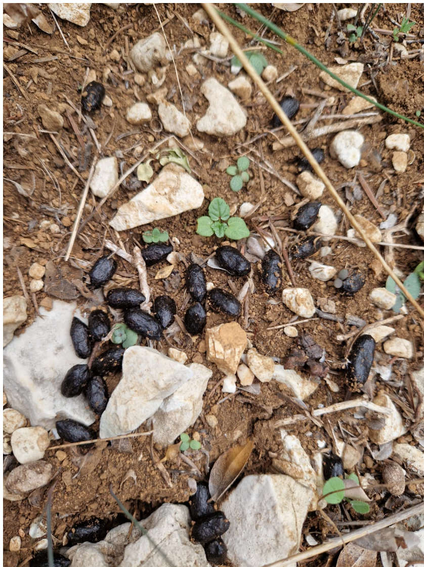
Figura 12 – Escremento di Capriolo ( Capreolus capreolus ).