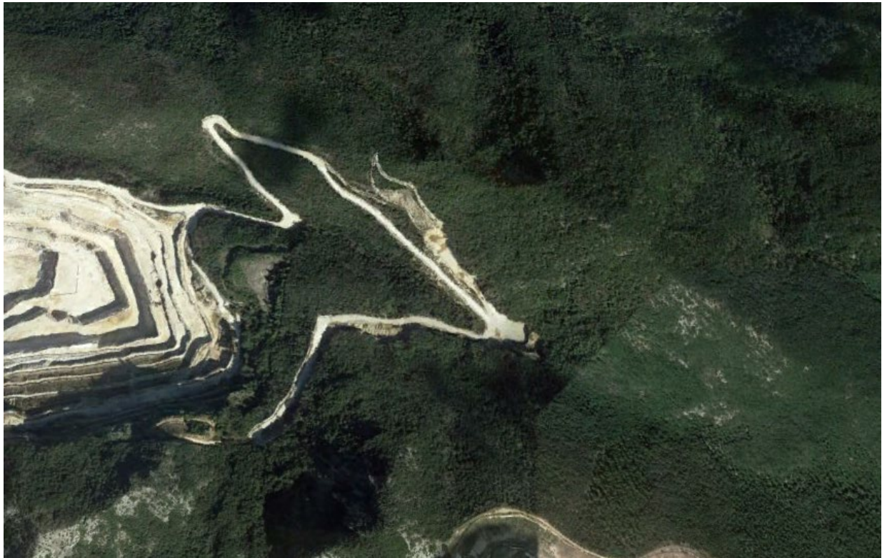
Figura 3 – Immagine satellitare dell’area di studio.