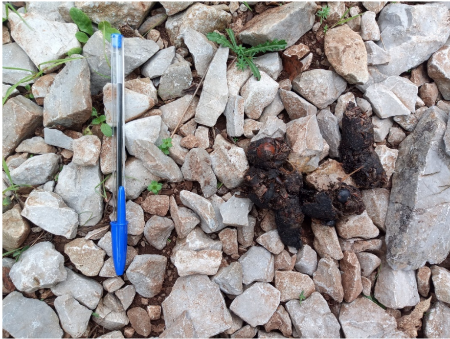
Figura 17 – Escremento di volpe ( Vulpes vulpes ) con residui vegetali