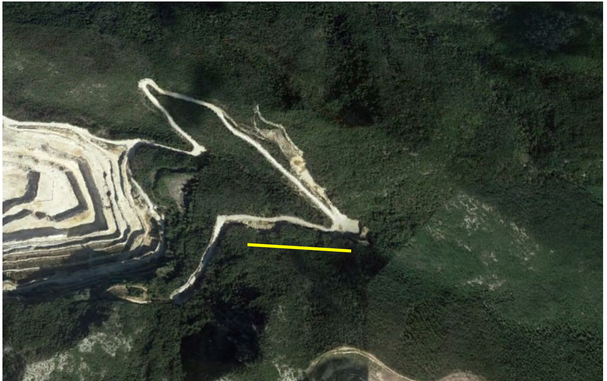
Figura 10 – Immagine satellitare del transetto MAM_02.