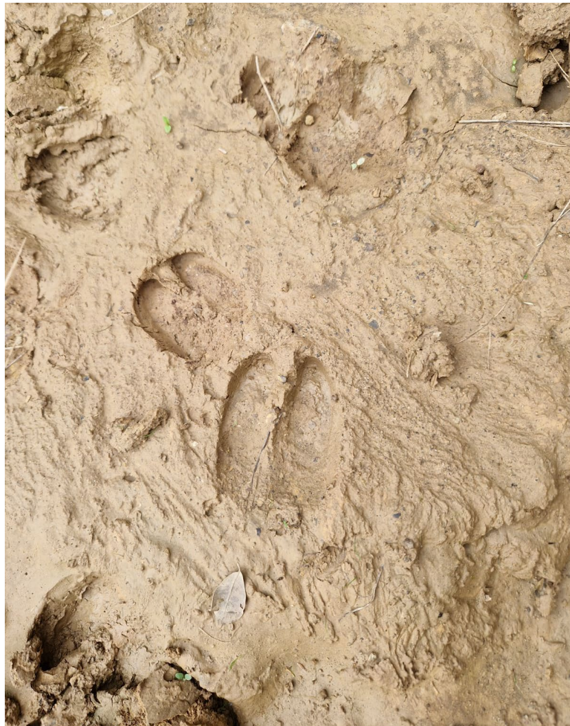
Figura 16 – Impronta di cinghiale ( Sus scrofa )