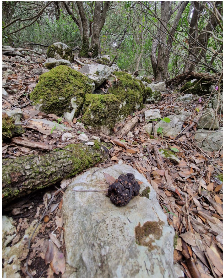
Figura 18 – Escremento di cinghiale ( Sus scrofa )