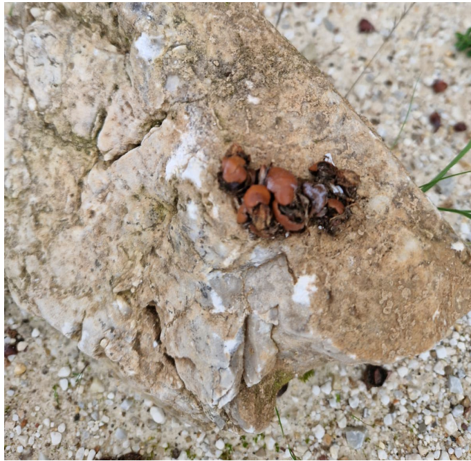
Figura 13 – Escremento di volpe ( Vulpes vulpes ) con residui vegetali