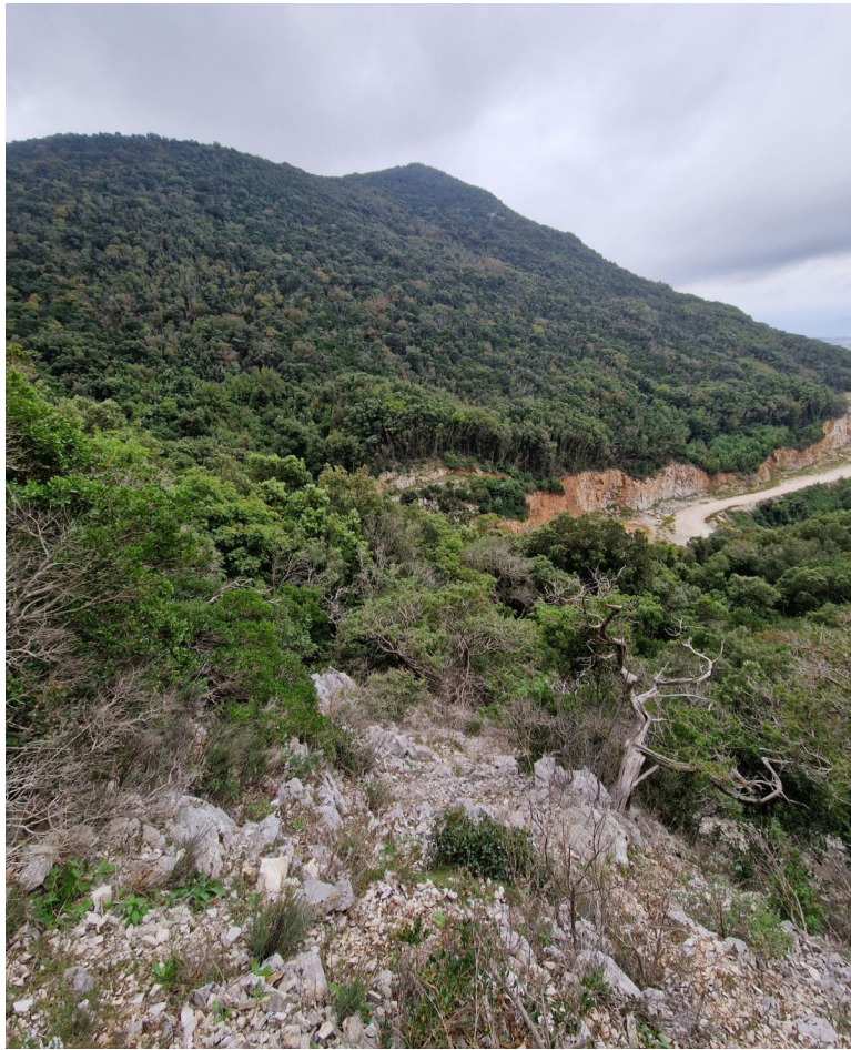
Figura 4 – Visuale dal versante nord dell'area di studio.