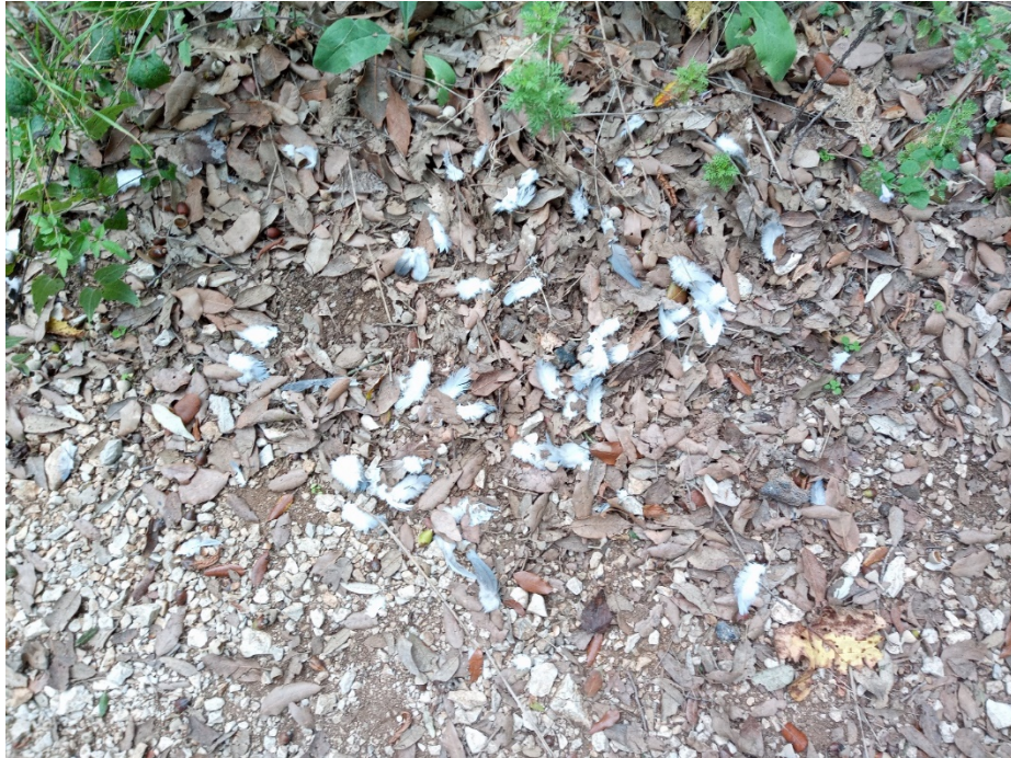
Figura 20 – Residui di predazione di Falco pellegrino su Colombaccio.

Complessivamente, nel corso delle indagini con il metodo dei punti d'ascolto, sono state rilevate 18 specie ornitiche, di cui 6 appartenenti ai Non Passeriformes (33%) e 12 all'ordine dei Passeriformes (67%). In particolare, di queste Falco peregrinus ed Accipiter nisus risultano inserite nell'Allegato I della Direttiva 2009/147/CE.