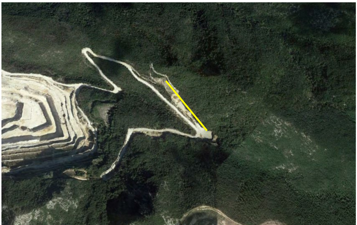
Figura 5 – Immagine satellitare del transetto ANF_01.